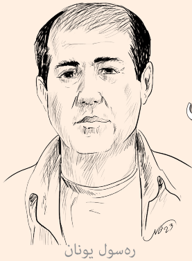
ره سول يونان